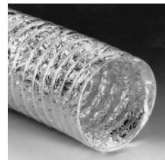
Hochflexibler Aluminiumschlauch 3 Lagen Aluminium 1 Lage Polyester

Andere Durchmesser und Ausführungen auf Anfrage.